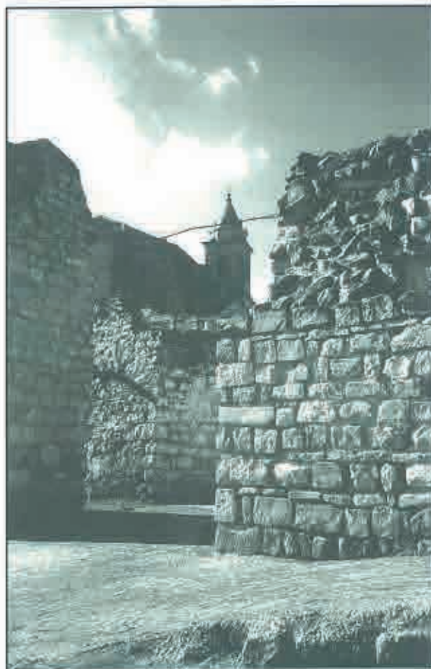
En este lugar estuvo situada la Puerta de Santa María.

-Algo así diría yo. Lógicamente si no hay reconstrucción el pasado se nos viene abajo, pero