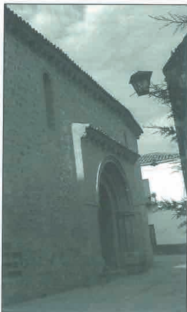
Baeza. La puerta "colocada" por Bellas Artes.

Mi punto de vista en este sentido coincide en lo fundamental con el mantenido por la Comisión de Arte del Consejo Sectorial de Cultura, Arte y Medio Ambiente al que pertenezco. Lamento, en consecuencia, que últimamente se haya prescindido de dicha Comisión (e incluso de este modesto Cronista) para la realización de obras que son competencia de la misma: estoy de acuerdo y satisfecho con otras de las realizadas (la Ronda, el Pasaje, el nuevo Parque...), y siento que muchos de los proyectos propuestos no se hayan llevado a cabo pese a no ser caros ni difíciles (Calzada de la muralla, Cruz de Escaleras, Puerta de Santa María...). Reconozco y lamento que para la ejecución de muchas de las