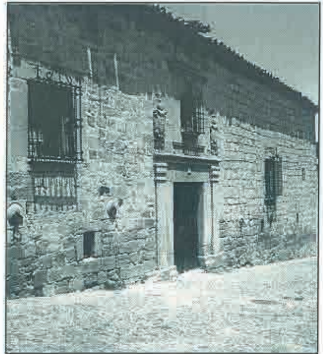
Fachada de la casa antes de su restauración.