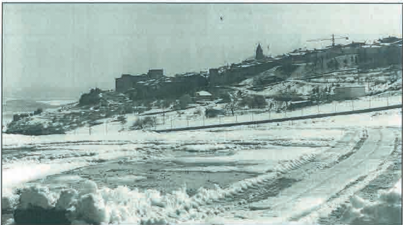
Sabiote, nevado, visto desde las tierras de La Serna

Y así es, pues en los refranes y dichos de tipo geográfico, es decir, referentes a pueblos y lugares