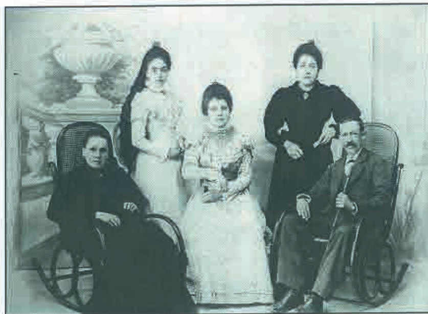
El matrimonio Madrid-Casado con sus hijas.